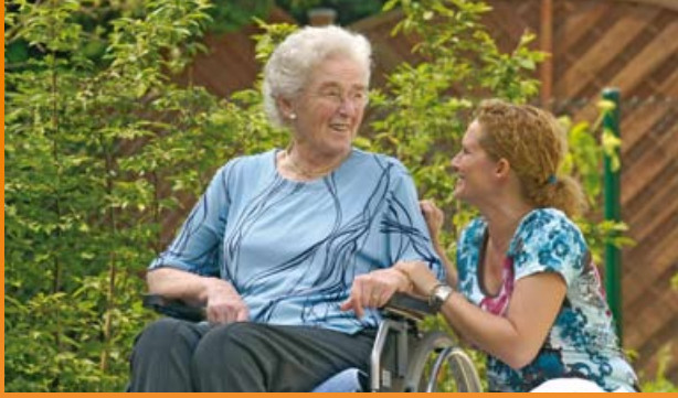
CMS – Mit Sicherheit die richtige Wahl