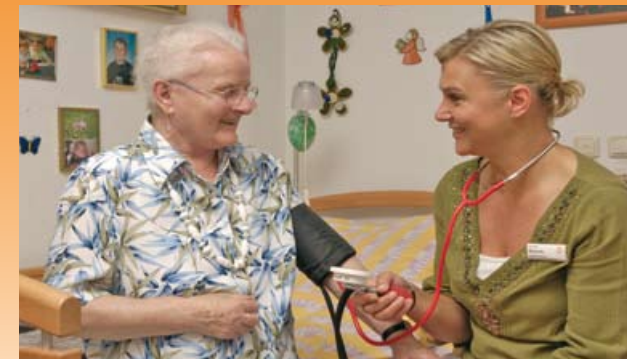
Unser geschultes Personal achtet auf Ihre Gesundheit

Um dies zu gewährleisten, liegen uns sowohl die soziale Kompetenz, als auch die fachliche Qualifikation der Mitarbeiter besonders am Herzen.