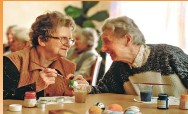
Geselligkeit und Lebensfreude bis ins hohe Alter

Unsere Mitarbeiter organisieren eine Vielzahl regelmäßig stattfindender Veranstaltungen. Das Angebot orientiert sich dabei natürlich stets an den Wünschen unserer Bewohner. Gern gesehen sind auch Gäste jeden Alters aus der Nachbarschaft unseres Hauses.