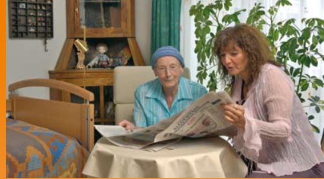
Empfangen Sie Ihre Gäste in den eigenen vier Wänden

Die Leitung und die Mitarbeiter des Hauses