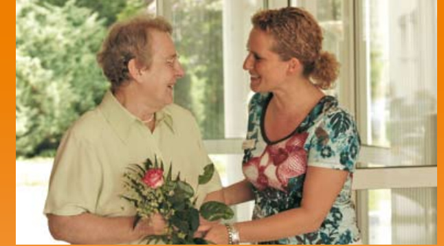
Wir begegnen Ihnen mit Offenheit und Respekt

Gerne beraten wir Sie persönlich und führen Sie durch unser Haus.