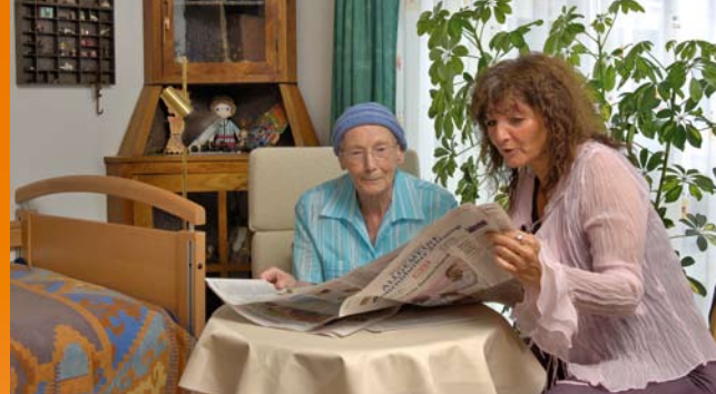
Empfangen Sie Ihre Gäste in den eigenen vier Wänden

Die Leitung und die Mitarbeiter des Hauses