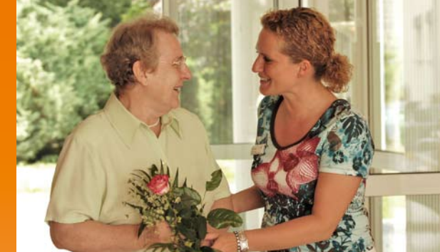
Wir begegnen Ihnen mit Offenheit und Respekt

Gerne beraten wir Sie persönlich und führen Sie durch unser Haus.