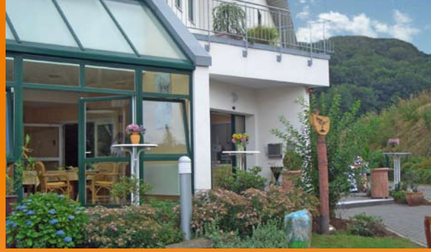
CMS – Mit Sicherheit die richtige Wahl