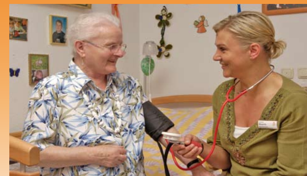
Unser geschultes Personal achtet auf Ihre Gesundheit

Um dies zu gewährleisten, liegen uns sowohl die soziale Kompetenz, als auch die fachliche Qualifikation der Mitarbeiter besonders am Herzen.