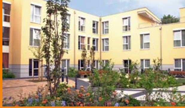
CMS – Mit Sicherheit die richtige Wahl