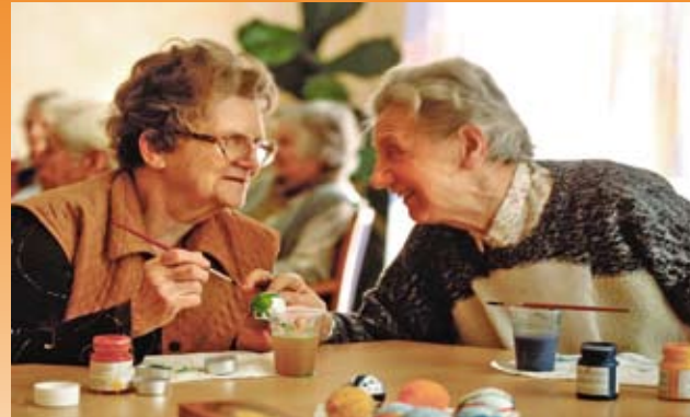
Geselligkeit und Lebensfreude bis ins hohe Alter

Unsere Mitarbeiter organisieren eine Vielzahl regelmäßig stattfindender Veranstaltungen. Das Angebot orientiert sich dabei natürlich stets an den Wünschen unserer Bewohner. Gern gesehen sind auch Gäste jeden Alters aus der Nachbarschaft unseres Hauses.