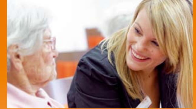
Wir begegnen Ihnen mit Offenheit und Respekt

Gerne beraten wir Sie persönlich und führen Sie durch unser Haus.