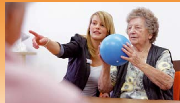
Individuelle therapeutische Maßnahmen

Um dies zu gewährleisten, liegen uns sowohl die soziale Kompetenz, als auch die fachliche Qualifikation der Mitarbeiter besonders am Herzen.