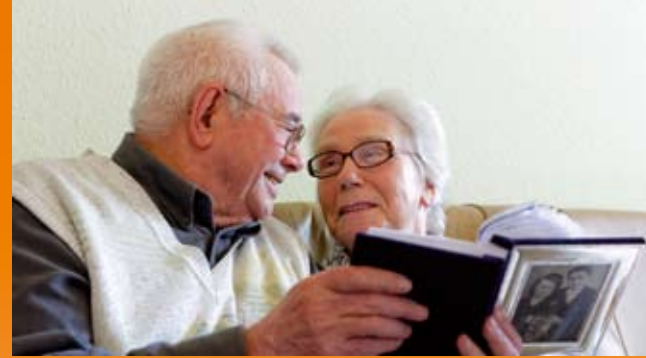
Wohnungen passend zur individuellen Lebenslage

Die Leitung und die Mitarbeiter des Hauses