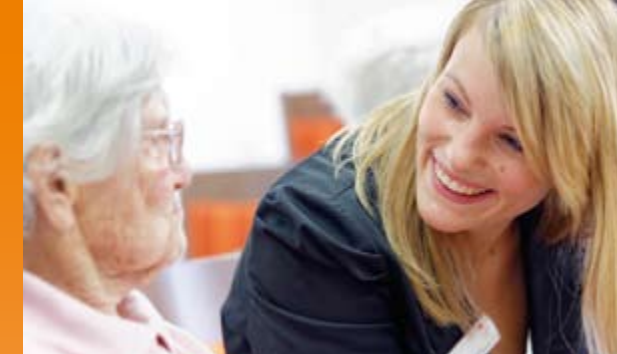
Wir begegnen Ihnen mit Offenheit und Respekt

Gerne beraten wir Sie persönlich und führen Sie durch unser Haus.