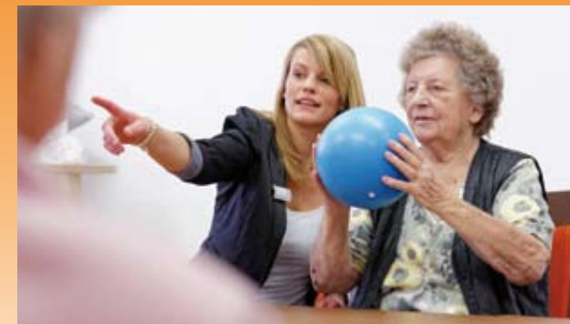
Individuelle therapeutische Maßnahmen

Um dies zu gewährleisten, liegen uns sowohl die soziale Kompetenz, als auch die fachliche Qualifikation der Mitarbeiter besonders am Herzen.