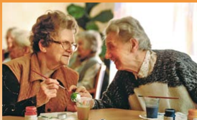
Geselligkeit und Lebensfreude bis ins hohe Alter

Unsere Mitarbeiter organisieren eine Vielzahl regelmäßig stattfindender Veranstaltungen. Das Angebot orientiert sich dabei natürlich stets an den Wünschen unserer Bewohner. Gern gesehen sind auch Gäste jeden Alters aus der Nachbarschaft unseres Hauses.