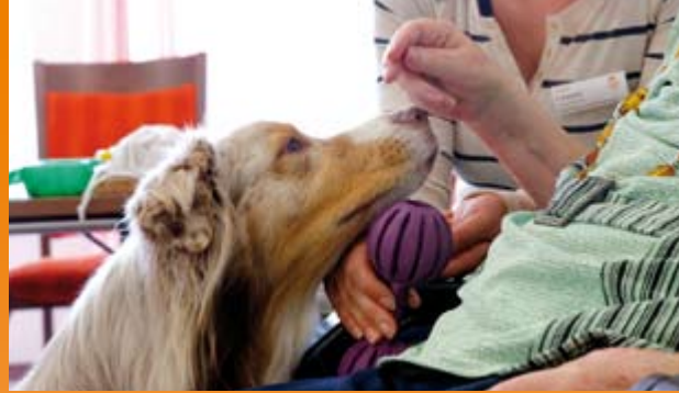
Therapeuten auf vier Pfoten im Einsatz