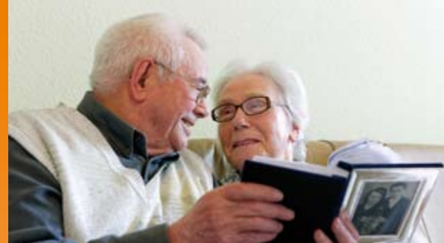
Wohnungen passend zur individuellen Lebenslage

Die Leitung und die Mitarbeiter des Hauses